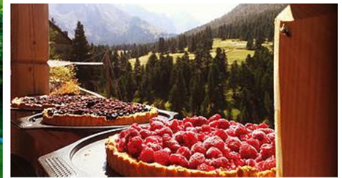
Les tartes des Granges